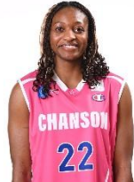
ンウオコ マーベラス アダク ビクター (シャンソン化粧品 シャンソン V マジック#22)